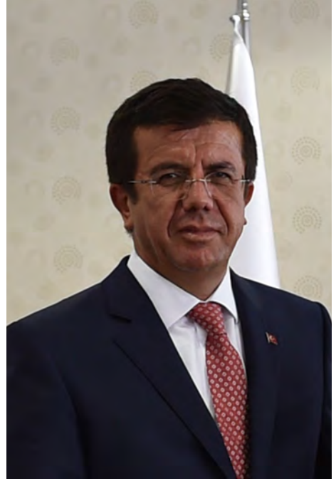
Nihat ZEYBEKÇİ Ekonomi Bakanı

2023 için belirlediğimiz 500 milyar dolar ihracat hedefine ulaşmak ve küresel ekonominin önde gelen aktörlerinden biri olmak için Ekonomi Bakanlığı olarak ihracatçılarımızla birlikte yoğun şekilde çalışıyoruz.