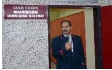
Resim 1.3: Mübaşir

Duruşmalara tarafların çağırılması, duruşma salonuna alınması ve duruşmanın disiplinini sağlamak için hâkim tarafından verilen görevleri yerine getirmekle görevli olan memurlardır.