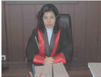
Resim 1.2: Savcı

Savcıların asıl görev alanı, ceza ve ceza yargılaması hukukudur. Özel hukuka ilişkin davalarda kural olarak savcıların bir görevi yoktur. Ancak, çok istisnai hâllerde savcılara hukuk davalarını açma görevi verilmiştir. Bu hâller ise kamu düzeniyle ilgili olan hâllerdir