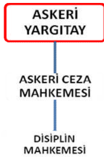
Şema 1.2: Askerî Yargıtay alt birimleri

Bunların bazılarının da kendi alt birimleri vardır: