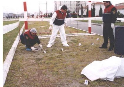
Resim 2.2: Delillerin toplanması