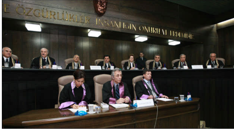
Resim 1.8: Anayasa Mahkemesi ve üyeleri