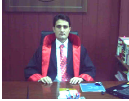
Resim 1.1: Hâkim

Adli ve idari yargı olmak üzere iki ana kola ayrılan hâkimlik mesleği, adli yargı bakımından sadece Hukuk Fakültesi mezunları arasından ihtiyaca göre açılan sınavlarla seçilirler. İdari yargı hâkimleri ise başta hukuk fakültesi olmak üzere siyasal bilgiler, iktisadi ve idari bilimler fakültesi mezunları arasından sınavla seçilmektedir. Yüksek mahkemeler olan Yargıtay, Danıştay ve Anayasa Mahkemesinin hâkim üyeleri ise Cumhurbaşkanı tarafından seçilerek atanmaktadır.