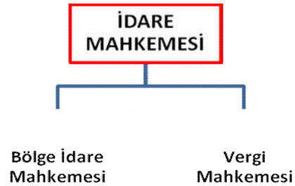
Şema 1.3: İdare Mahkemesi alt birimleri