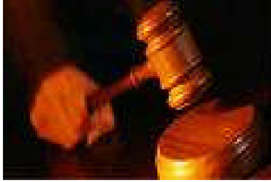
Resim 2.3: Karar ve hüküm

Kararın en önemli unsuru hüküm sonucudur. Hüküm sonucu kısmında, gerekçeye ait herhangi bir söz tekrar edilmeksizin tarafların istem sonuçlarından her biri hakkında verilen hükümlerle taraflara yüklenen borç ve hakların, sıra numarası altında açık, şüphe ve tereddüt uyandırmayacak şekilde gösterilmesi zorunludur. Ayrıca karara karşı gidilebilecek kanun yollarının (temyiz yolu açık olmak üzere gibi) gösterilmesi gerekir. Böylece hükme karşı kanun yoluna başvurmak isteyen tarafa kanun yoluna başvurma hakkı hatırlatılmış olur. Ancak, bir kararda aslında tarafın veya tarafların her ikisinin kanun yoluna başvurma hakları olmasına rağmen bu hak gösterilmemiş olsa bile taraflar yine de kanun yoluna başvurabilirler.