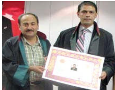
Resim 1.4: Avukatlar

Ülkemizde bir dava açabilmek veya açılmış olan davayı takip edebilmek için avukat tutma zorunluluğu yoktur