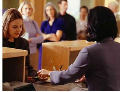
Resim 1.6:Noterde bir işlem