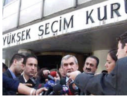
Resim 1.9: Yüksek Seçim Kurulundan açıklama

Seçimlerin Temel Hükümleri ve Seçmen Kütükleri Hakkında Kanun'un ilgili maddelerinde zikredilen (ifade edilen) seçimle ilgili görevleri yerine getirmekle yükümlüdür.