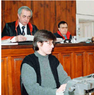
Resim 1.7: Mahkemede bir oturum (hâkim ve zabıt kâtibi)

Bir hukuk davasının hangi mahkemede görüleceği sorunu, görev kurallarının konusunu oluşturur. Görev konusu kamu düzenine ilişkin olup emredici nitelik taşır. Bir davanın görüleceği mahkeme, dava konusunun miktarı veya değerine göre belirlenebileceği gibi, davanın niteliğine göre de belirlenebilir. Bunların yanında davalara çeşitli kanunlarla görevlendirilmiş özel uzmanlık mahkemelerince de bakılabilir.