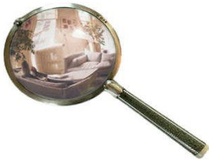
Resim 2.1: Delil toplama

Dava açan taraf veya davalı, kendisinin haklı olduğunu ispat etmek için kendi lehine olan olayları ve delilleri dilekçesinde mahkemeye bildirmelidir. Örneğin, (A) bir satım sözleşmesi nedeniyle (B) den alacaklı olduğunu iddia ederek dava açarsa dava dilekçesine alacağını gösteren senedi veya sözleşmeyi de eklemelidir. Aynı şekilde bu davada borcunu ödemediği için borçlu olmadığını ileri süren davalı da borcun ödendiğine dair bir makbuzu mahkemeye sunmalıdır. Örneğin, bir trafik kazası nedeniyle tazminat davası açan (A), bu davada olayı gören tanıkların ismini mahkemeye bildirmelidir. İsmi mahkemeye bildirilmeyen tanıkların dinlenmesi mümkün değildir.